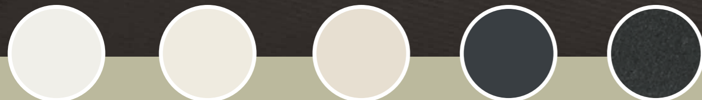
RAL 9016 VERKEERSWIT

De Terrasoverkapping plissé is leverbaar in 5 standaard RAL-kleuren. Uiteraard is een afwijkende kleur ook altijd mogelijk, zodat dit één op één aansluit op de overkapping. De beschikbare standaard RAL-kleuren zijn: